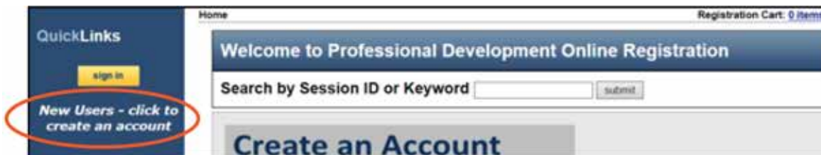
Fig 1. Image clip of QuickLinks new users registration page